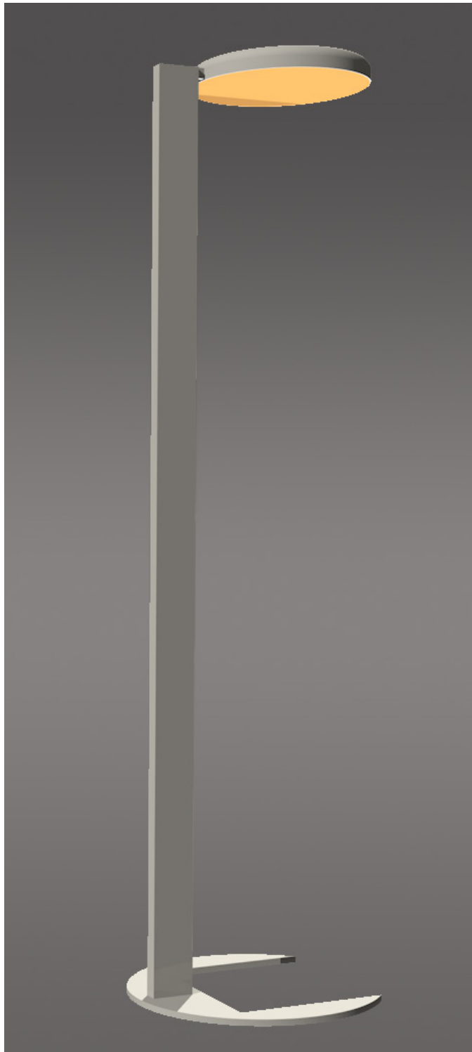
PAN II ST