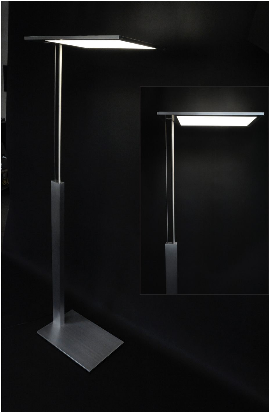
SilverScreen ST 600